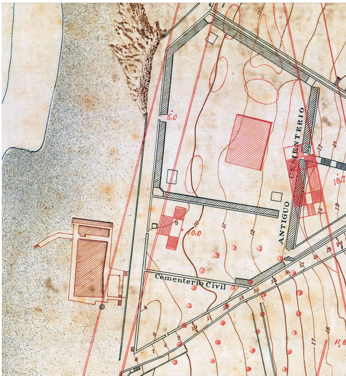
Cementerio de Picacho no plano urbanístico do enxeñeiro Ramiro Pascual de 1907

evitar outros incidentes), argallando que aumentar o adro custaría poucos cartos sacados dos propios e arbitrios -ingresos do Concello- nin hai fontes ou canos que prexudiquen aos veciños. Tan apaixonado desencontro manifesta a postura da Igrexa por perder ingresos eclesiásticos, fronte á necrópole municipal.